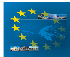
INTERREG IIIA Grecia - Italia