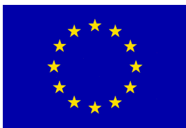
FESR Fondo Europeo di Sviluppo Regionale